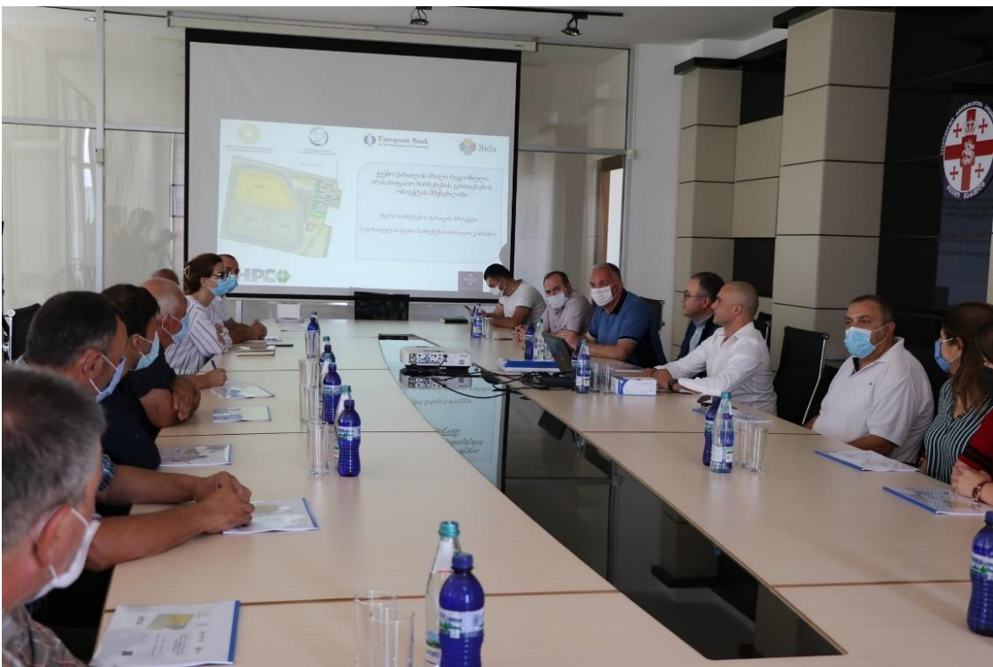
სურათი 2 და 3: შეხვედრა ადგილობრივ ხელისუფლებასთან და ქვემო ქართლის მაცხოვრებლებთან.