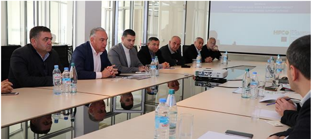
სურათი 1: შეხვედრა ადგილობრივ ხელისუფლებასთან

დაინტერესებულ მხარეებთან რამდენიმე შეხვედრა გაიმართა. ერთ-ერთი მათგანი ჩატარდა 2019 წლის დეკემბერში PMCG-სა და მისი საერთაშორისო პარტნიორის - საინჟინრო კომპანიის (HPC), ქვემო ქართლის გუბერნატორისა და ხუთი მუნიციპალიტეტის მერისა (თეთრი წყარო, მარნეული, დმანისი, ბოლნისი და წალკა) და პროექტის ბენეფიციარის- საქართველოს მყარი ნარჩენების მართვის კომპანიის ორგანიზებით, ევროპული დირექტივების მიხედვით შემუშავებული პროექტის კონცეფციის წარსადგენად.